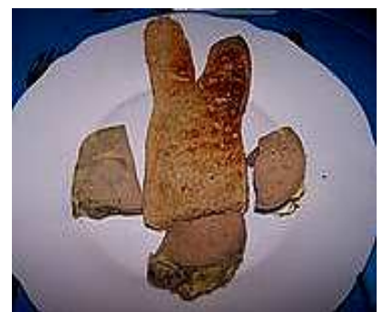
foie au FAO avec pain grillé en forme de petit lapin LVC 'sans sel" pour Doudou- lapin ...

Déguster sur des toasts de pain grillés, du pain aux figues ou aux noix , d'aucuns l'aiment sur de la brioche, agréable avec du "vrai" pain d'épices, voir pour les "sans sel" vos grilletines grillées . Mais le "must" bien sûr une grosse miché de campagne avec une crôte bien craquante