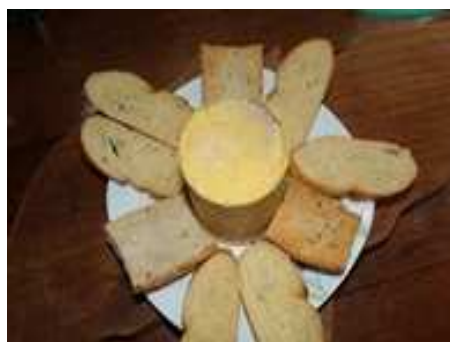
servez votre foie avec des pains divers ici : aux graines et "langues "sans sel" foie gras "en boîte LVC