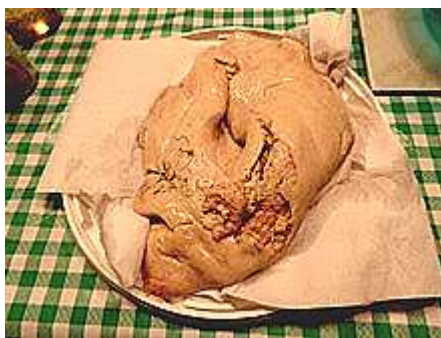
et enlever au maximum les veines