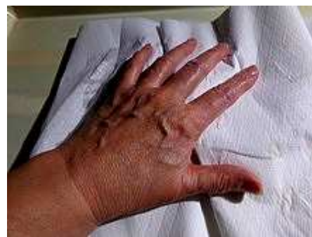
essuyez très très soigneusement

Bien les "essorer" et laissez-le "s'essuyer" à fond dans un torchon pour que vous n'avez pas d'eau qui ressorte lors de la cuisson .