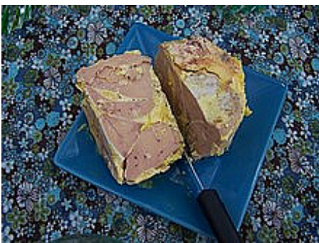
terrines traditionnelles au foie entier à couper en tranches pas trop fines et ...dégustez le "gras"!

Avantage de cette technique vous pourrez manger votre foie dans dix ans !!! Il va même largement y gagner .Nous avons même dégusté un jour un foie de vingt ans "oublié" plus ou moins volontairement au fond d'une étagère : nous n' avons jamais dégusté une telle merveille ... et nous n'en avons jamais mangé un tel depuis . Je reconnais que c'était un "vrai" foie de "mémé" . Sans en arriver à de tels délais, j'ai juste constaté que le temps fait son oeuvre et que le foie c'est comme les vieilles chouettes :ça "bonifie" avec le temps .