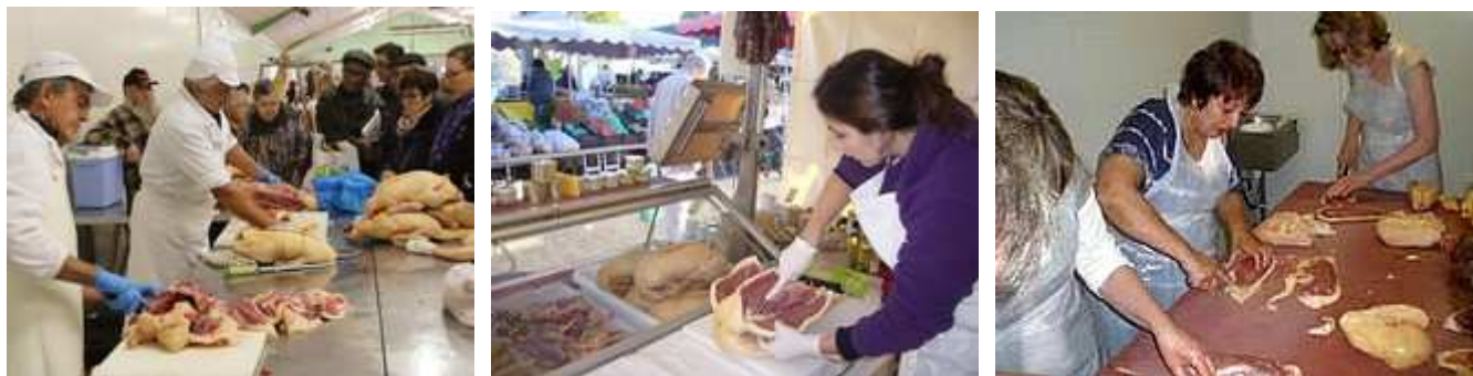
Quelques photos de nos marchés du Sud-Ouest et du découpage des "mantels"

Au moins vous n'avez plus qu'un seul risque que le foie pourtant si beau, ne réduise d'une façon drastique à la cuisson . N'accusez pas systématiquement votre vendeur d'avoir "drogué" la bête : un vrai et bon foie, bien gavé et bien naturel va "rendre" plus de graisse que celui du canard voisin, élevé pareil ... C'est un produit naturel et seule la Nature sait . Ne regrettez pas encore, car vous risquez une bonne surprise : il y a des foies qui "réduisent" pas et qui sont moyens au goût et des foies qui "rendent" plein de gras mais qui sont si bons ... que vous regretterez encore plus qu'il soit si petit . Consolation ? Dans ce cas le gras de foie c'est le sommet , l'Everest de la graisse culinaire